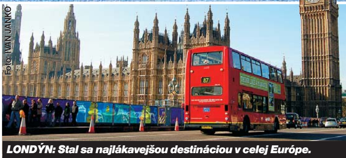
LONDÝN: Stal sa najlákavejšou destináciou v celej Európe.

CHCETE cestovať na najbližšiu dovolenku do niektorého z najvychytenejších kútov v Európe? Vyberajte podľa zoznamu držiteľov prestížnych cien WTA 2007.