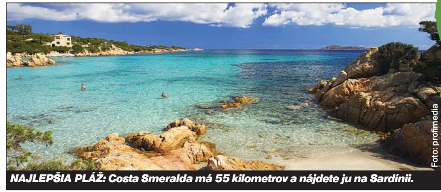
NAJLEPŠIA PLÁŽ: Costa Smeralda má 55 kilometrov a nájdete ju na Sardínii.

Ak chcete dovolenku potešiť najmä vaše deti, vyberte sa na budúci rok na Cyprus. Kráľom vodnej zábavy nasledujúceho leta totiž bude tamojší Fasouri Watermania Waterpark pri meste Limassol. Pri výbere ktoréhokoľvek držiteľa bronzovej sošky WTA 2007 však počítajte so zvýšenými cenami. Veď aj režisér po zisku Oscara inkasuje za nasledujúce filmy masťnejší honorár.