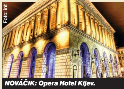
NOVÁČIK: Opera Hotel Kijev.

mesiacoch má na konte prestížnu cenu WTA. Uvidíme, či sa niečo podobné raz podarí aj slovenským finančným žralokom, ktorí sa pustili do budovania slovenských luxusných hotelov.